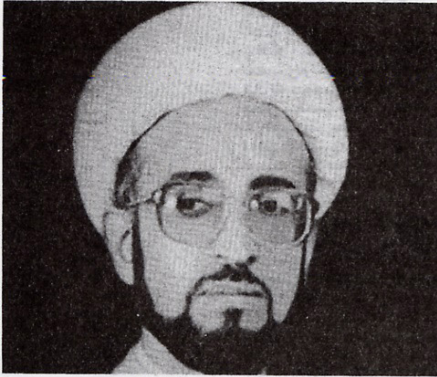
الشيخ حسن الصفار

اجترار الخلافات التاريخية، والانشغال بالمسائل النظرية. كثرت في الآونة الأخيرة دعوات الحوار بين الأديان أضلعة لحوار الحضارات، كيف ترين أهمية ذلك؟ ثم ليس من الجدي أن يتحقق الحوار الإسلامي - الإسلامي أولاً؟ الجهود التي يبذلها العلماء المصلحون في هذا المجال هي محل تقدير واحترام، ومن أواخرها الاجتماع الذي عقد في عمان - الأردن، بداية نوفمبر (تشرين الثاني) 2001م، لاجتماع خبراء لمناقشة استراتيجيات التقريب بين المذاهب الإسلامية، التي نظفتها المنظمة الإسلامية للتربية والعلوم والثقافة (الإيسيسكو)، والمعهد العالمي للفكر الإسلامي، واللجنة الوطنية الأردنية للتربية والثقافة والعلوم بالتعاون مع جامعة اليرموك.