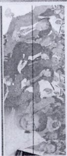
استخدام العنف والقوة خيار مرفوض